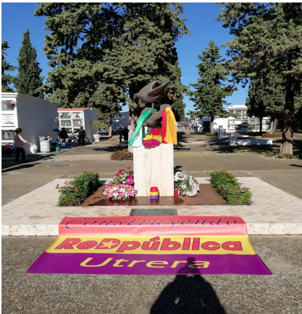
1936. Poema de Luís Cernuda

Recuperando la Memoria Histórica Recuperando los Valores Republicanos